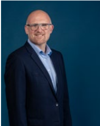
Grüßwort des Oberbürgermeisters der Stadt Duisburg Sören Link