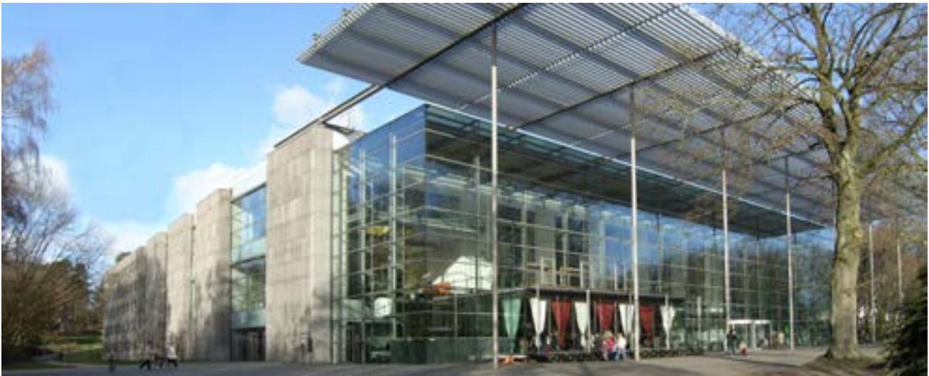
Unsere Veranstaltungslocation Ruhrfestspielhaus Recklinghausen