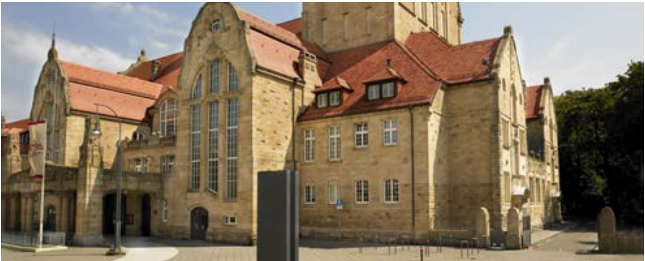
Unsere Veranstaltungslocation Jugendstil-Festhalle Landau