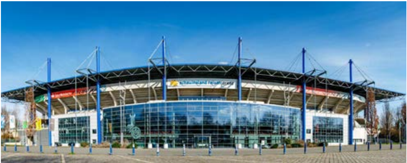
Unsere Veranstaltungslocation Schauinsland-Reisen-Arena