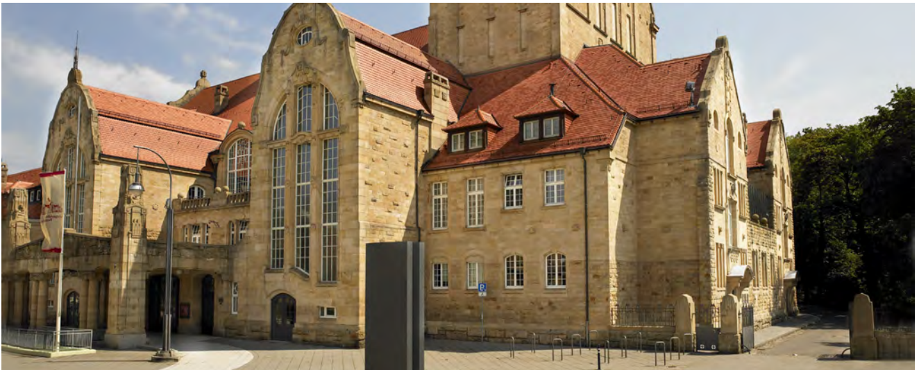
Unsere Veranstaltungslocation Jugendstil-Festhalle Landau