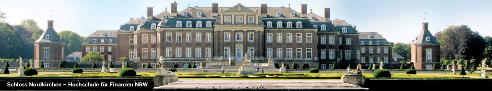
Schloss Nordkirchen – Hochschule für Finanzen NRW

Dual studieren und wohnen im Schloss Nordkirchen, in Hamminkeln oder Herford